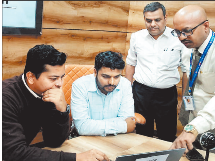
किसानों के खातों में राशि ट्रांसफर करते अधिकारी।

इस अवधि में अब तक 214 किसानों को लगभग 12 करोड़ रुपये सीधे उनके खातों में